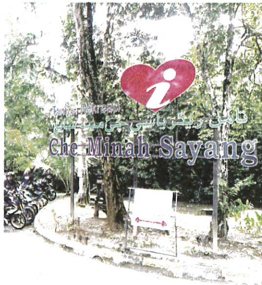
TAMAN Rekreasi Che Minah Sayang di Maran.

Justeru, Jabatan Kesihatan Negeri Pahang (JKNP) menasihatkan pihak pengurusan Ta-